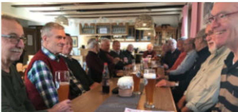
Das war im Sommer 2021.

Unten ein Bild vom Wanderziel Naturfreundehaus „Braunenberg“.