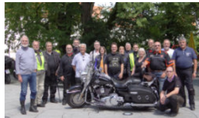
BSW-Ausfahrt 2019 vor Kloster Ursberg

BSW-Motorrad Tagesausfahrt Samstag 02. Juli 2022